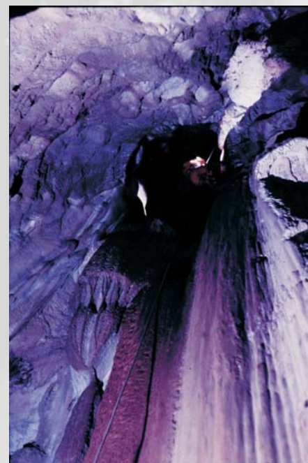
Grotta Abisso del Vento – Isnello (PA)