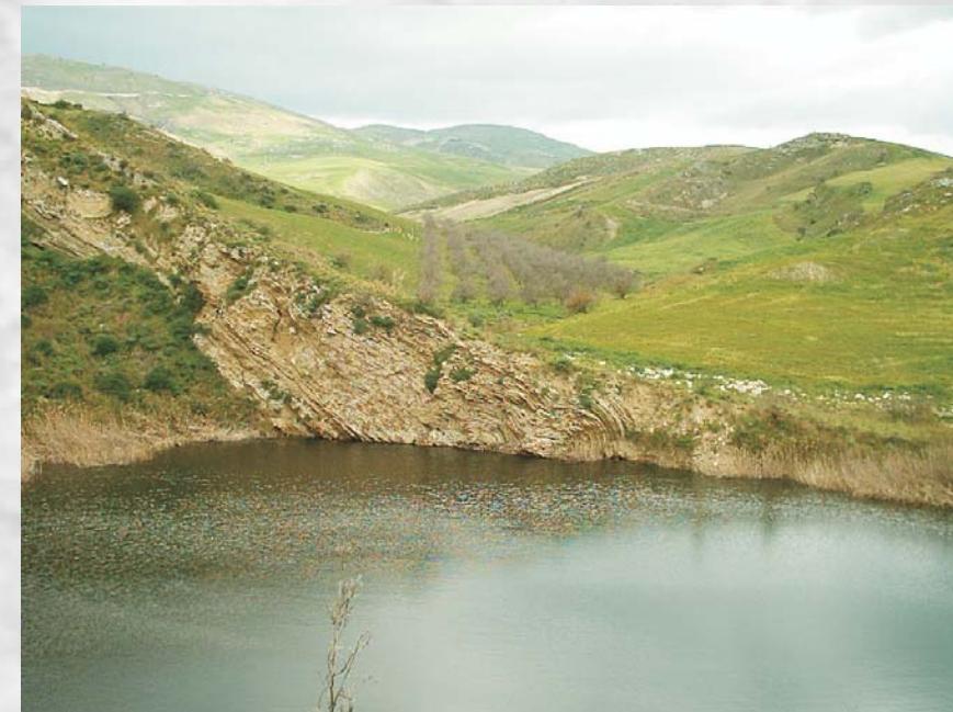
Lago Sfondato - Caltanissetta. La sua formazione è dovuta all'accumulo di acqua dentro una cavità poi sprofondata