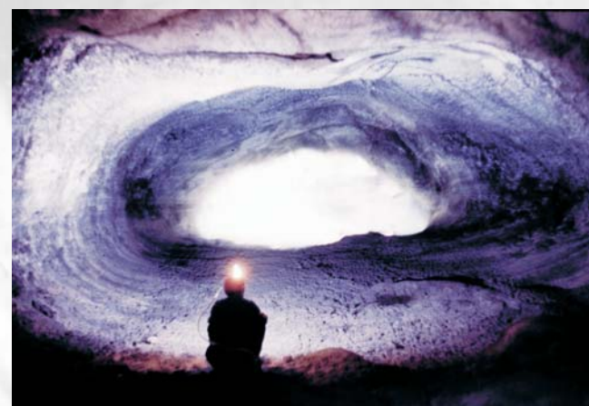
Grotta dei Lamponi - Catania