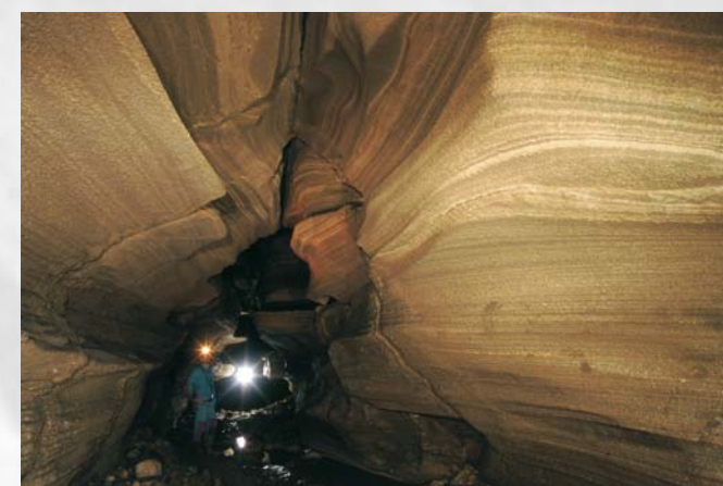
Grotta di Sant'Angelo Muxaro - Agrigento. Il ramo fossile