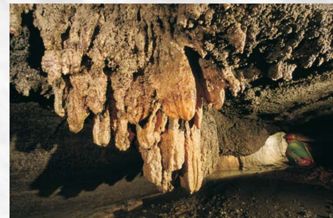
Grotta di Sant'Angelo Muxaro - Agrigento. Il ramo attivo