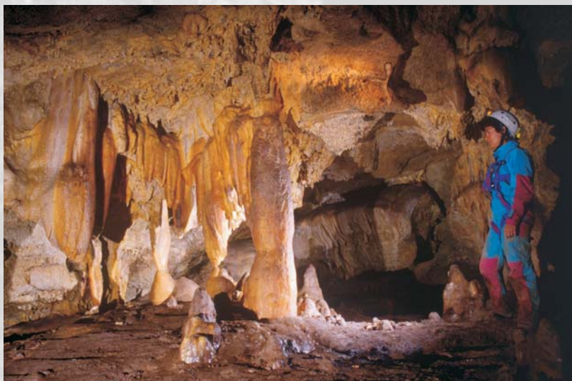
Grotta di Santa Ninfa – Santa Ninfa (TP)