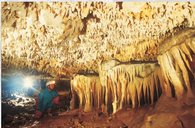
Grotta di Carburangeli – Carini (PA)